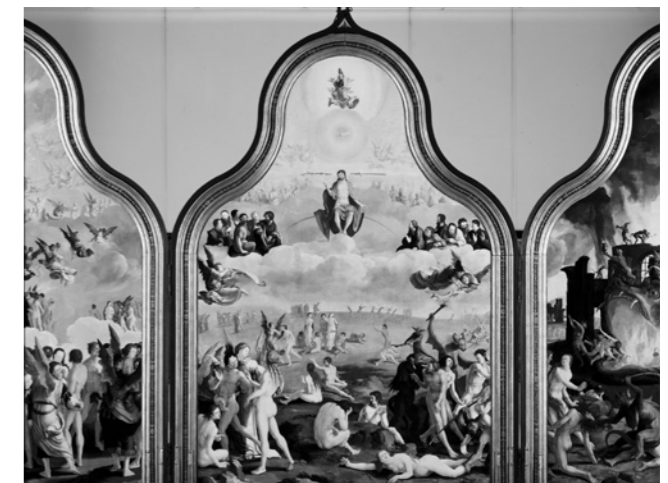
BRON 2 Het Laatste Oordeel van Lucas van Leyden. Dit grote drieluik hangt tegenwoordig in museum De Lakenhal in Leiden.